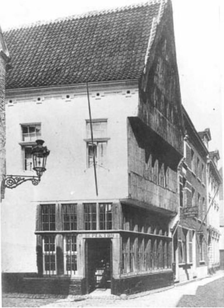
De Pekton aan het begin van de 20ste eeuw