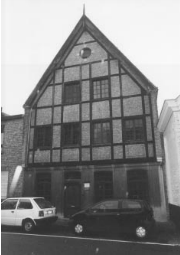
Het huis Sint-Antonius aan de Lange Hairgracht