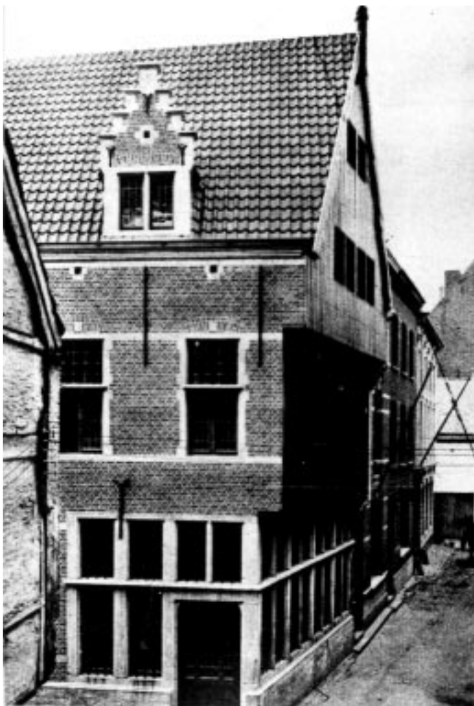
De Pekton na de restauratie van 1931