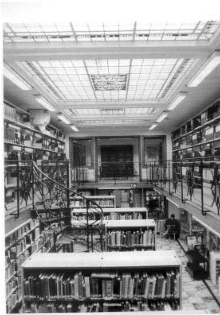
Metaal in de stadsbibliotheek te Vilvoorde